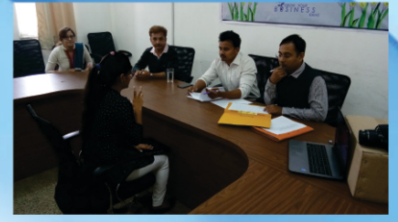
Mock Personal Interviews