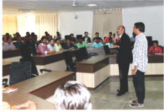
Resume Building Session & Competition