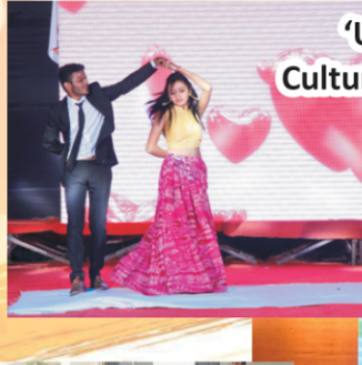
'UTSAV' Cultural Festival