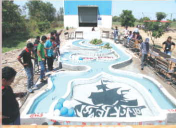
'MANTHAN' Technical Festival