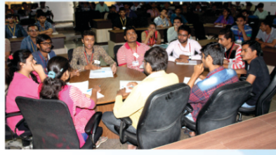
Group Discussion Practice Session