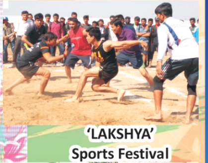
'LAKSHYA' Sports Festival