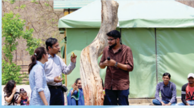
Open Management Learning Sessions