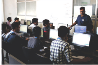
Aptitude Awareness Session & Mock Test