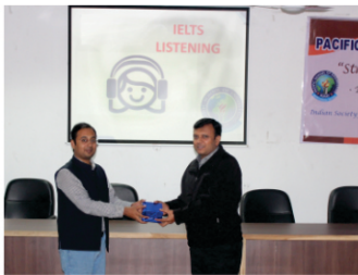
Abroad Study Guiding Session