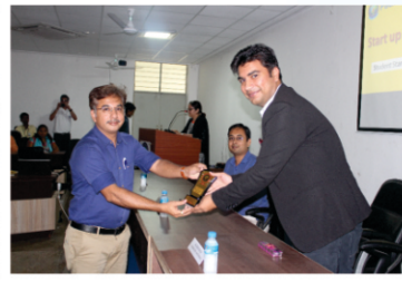
Entrepreneurship Development Program