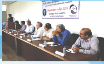
Symposium - Industry Institute Interaction Program