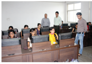
Mock GATE Examination